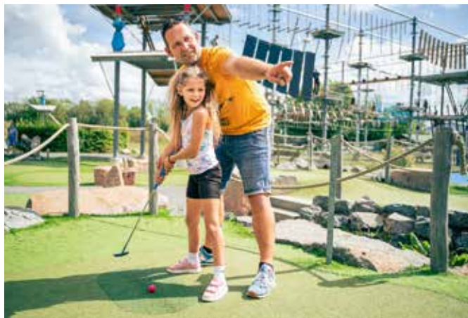
Einzigartig in der Region: Panorama-Klettern mit Blick über das Leipziger Neuseenland.

tert und gegolft werden. Die Hauptsaison geht vom 6. Juli bis zum 30. August und vom 12. bis zum 25. Oktober 2026. Die letzte Einweisung fürs Klettern erfolgt 2,5 Stunden vor Schließung, die letzte Ausgabe der Golfschläger eine Stunde vor Ende der Öffnungszeiten.