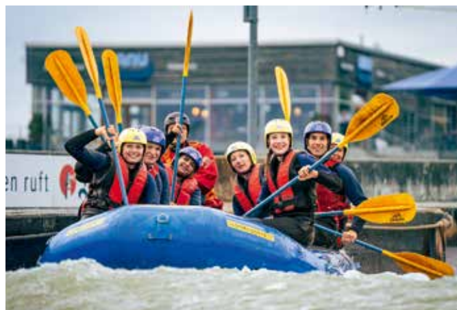
Wildwasser-Rafting im Kanupark Markkleeberg: Dieses unvergessliche Erlebnis kann ab sofort online gebucht werden.

Gruppen wie Unternehmen oder Schulklassen, die 2026 ein besonderes Erlebnis im Kanupark planen, finden auf der Website Informationen zu den verschiedenen Angeboten. Individuelle Termine, Event-Bausteine und Verfügbarkeiten können per E-Mail an vertrieb@kanupark-markkleeberg.com angefragt werden. Diese Adresse steht auch Freizeitsportlern für Anfragen zu Drachenboot-Touren oder Fahrten mit dem Mannschafts-Canadier auf dem Markkleeberger See zur Verfügung.