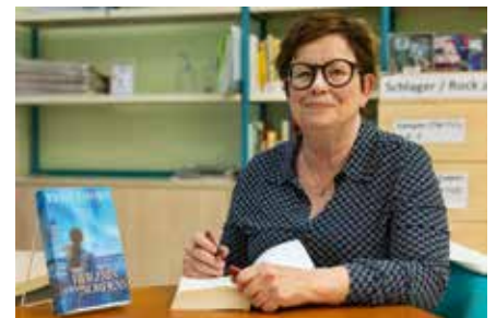
Markkleeberg aktuell Leipzig liest... in Markkleeberg