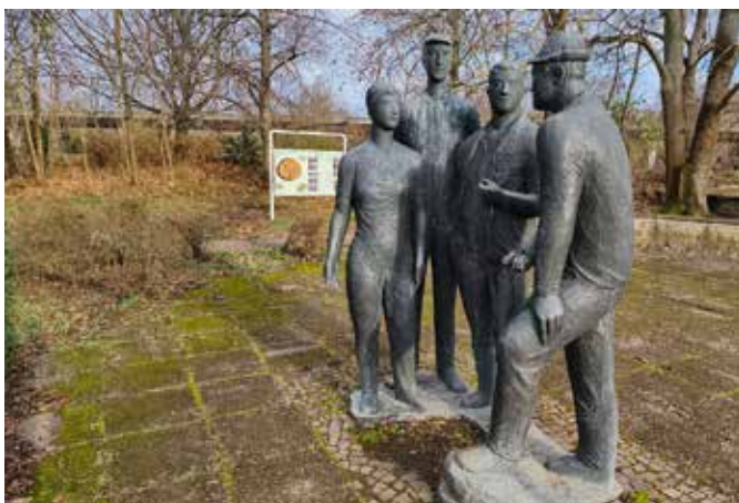
Die rechte Statue der Plastik wurde entwendet.

In der Zeit vom 5. März 2026, 16 Uhr, bis 6. März 2026, 6.30 Uhr, wurde im agra-Park eine Figur der Plastik „Klasse der Genossenschaftsbauern“ entwendet.