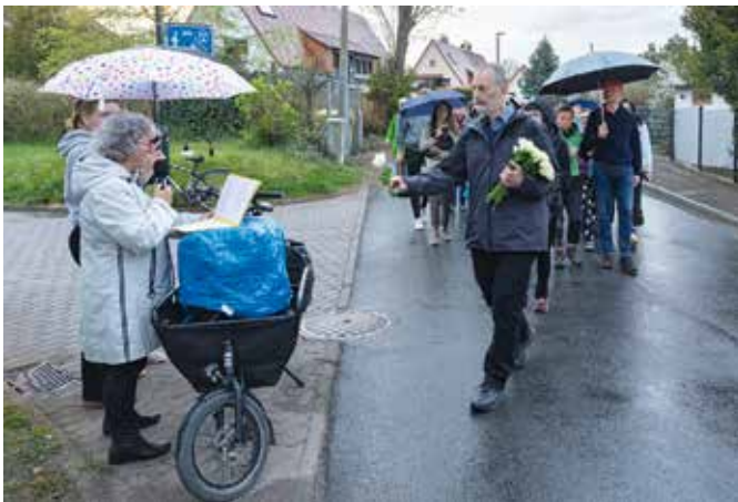
Beim Schneeglöckchen-Gedenkweg 2025