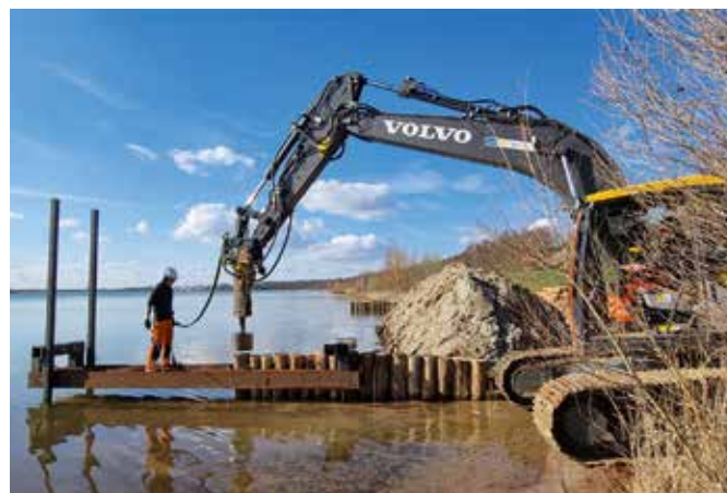
Am Auenhainer Strand werden zur zukünftigen Sicherung der Uferlinie insgesamt 14 Buhnen errichtet.

Die Bautätigkeiten sollen rechtzeitig zum Beginn der Badesaison abgeschlossen sein und künftig den Aufwand für Unterhaltungsarbeiten am Auenhainer Strand verringern. Während der Sanierung werden die Einschränkungen für Besucher am See so gering wie möglich gehalten: Der Strand ist nur abschnittsweise gesperrt, der Uferrundweg bleibt durchgängig nutzbar.