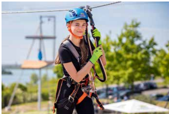
Am 18. April starten der Kletterpark Markkleeberg und die Adventure Golf Anlage in die Saison.