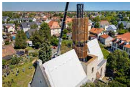
Verein Freunde der Fahrradkirche Zöbiger e.V.