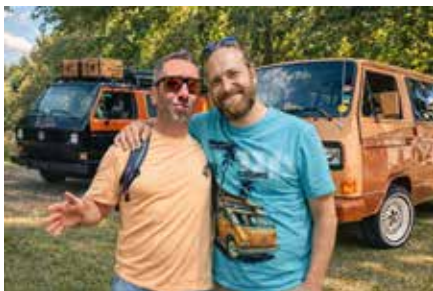
Porträt VW-Bus Freunde Neuseenland e.V.